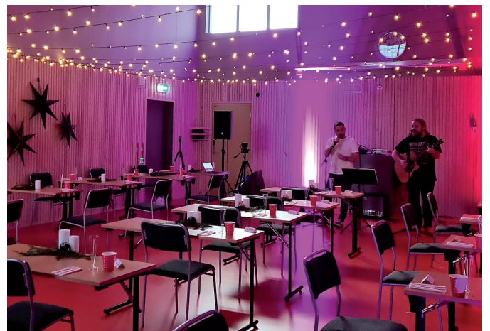
Generalforsamling til årets julelunsj