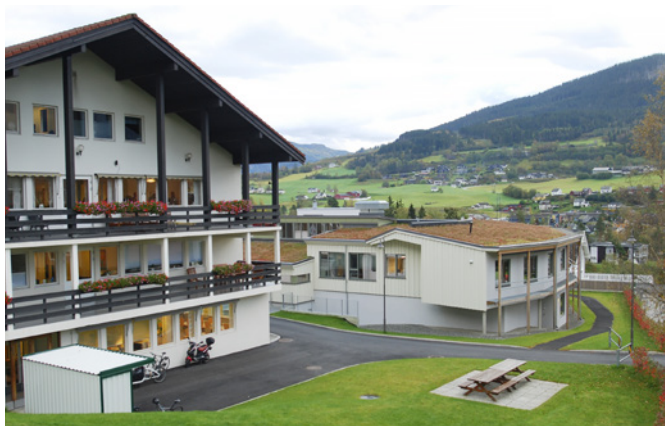
Gamle og nye bygg står godt i lag