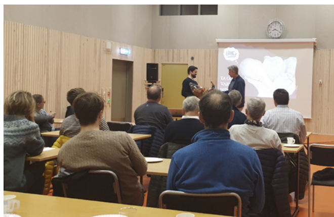
Emnekurs i psykiatri