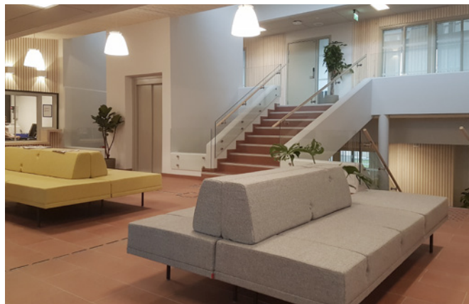
Nytt, triveleg venterom