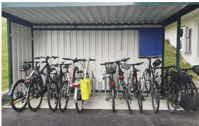
Godt brukt sykkelskur